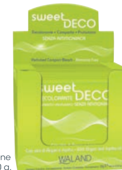
Contiene 12 bustine da > 20 g.