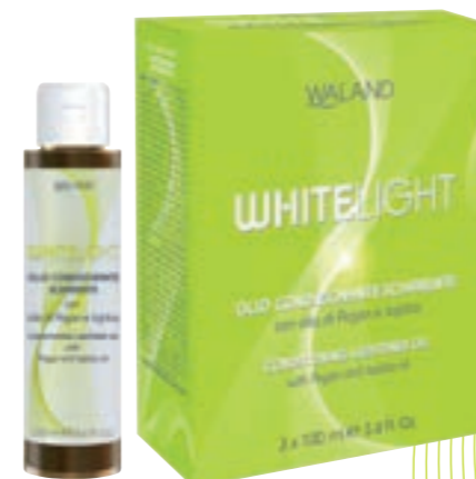
Contiene 3 flaconi da > 100 ml.

Nei superschiarenti > può essere usato, al 50% in diluizione 1+2 (es. 25 ml di crema colorante + 25 ml di olio + 100 ml di oss. 40 vol.).