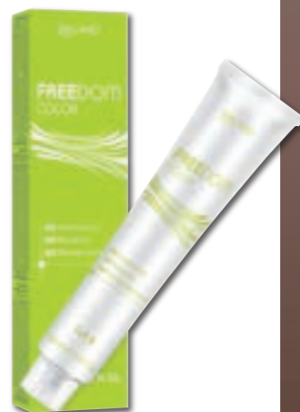
Formato: Tubo da >100 ml